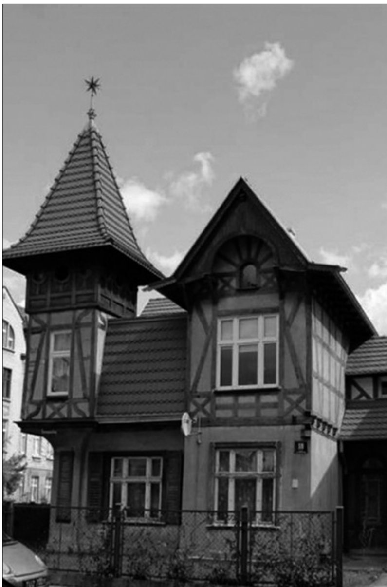
Il. 2. Toruń, willa przy ul. Marii Konopnickiej 18, widok ogólny obiektu.