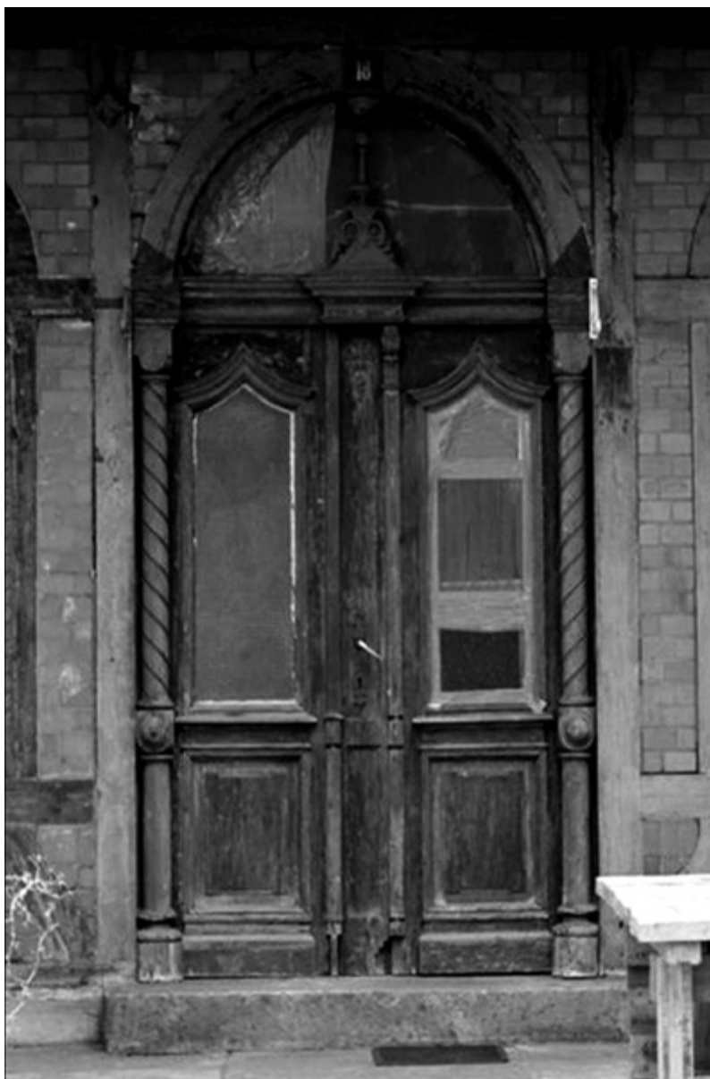
Il. 3. Toruń, willa przy ul. Marii Konopnickiej 18, detal.