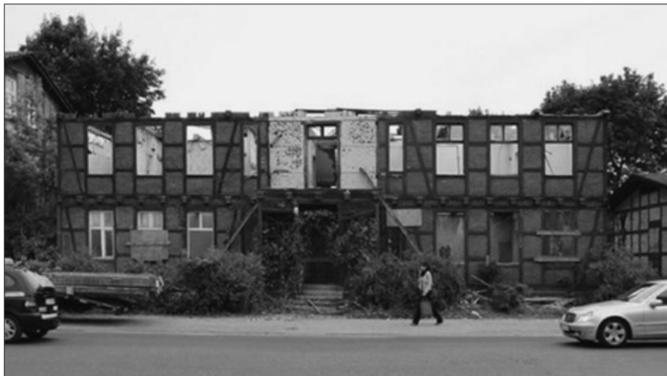
Il. 4. TORUŃ, budynek przy ul. Szosa Chełmińska 71, udokumentowany w trakcie rozbiórki.