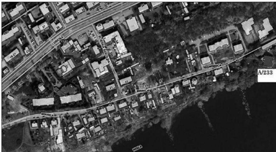
Il. 5. TORUŃ, ul. Winnica, budynki osady flisackiej wzniesione w konstrukcji muru pruskiego, które przetrwały do dnia dzisiejszego