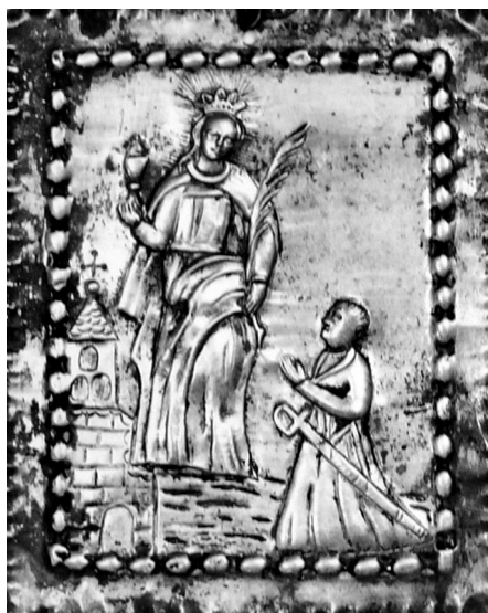
Il. 6 Plakietka z wyobrażeniem św. Barbary i donatorem, 1764 r., Muzeum Okręgowe w Toruniu (depozyt parafii)