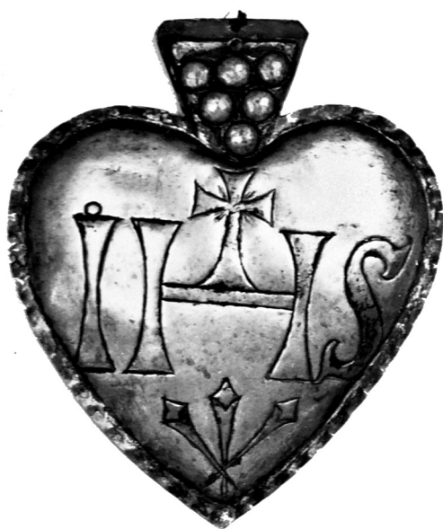
Il. 5 Plakietka wotywna fundowana przez Kazimierza Madejskiego, 1754 r., Magazyny Muzeum Diecezjalnego w Toruniu