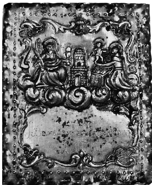
Il. 8 Plakietka wotywna fundowana przez Antoniego Jaśkiewicza, 1771 r., Muzeum Okręgowe w Toruniu (depozyt parafii)