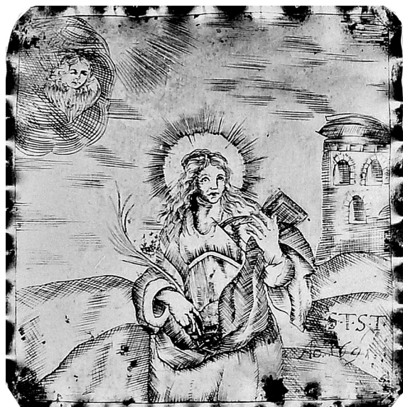
Il. 3 Plakietka wotywna fundowana przez Franza Polkowskiego, 1691 r., Johann von Hausen I, Muzeum Okręgowe w Toruniu (depozyt parafii)