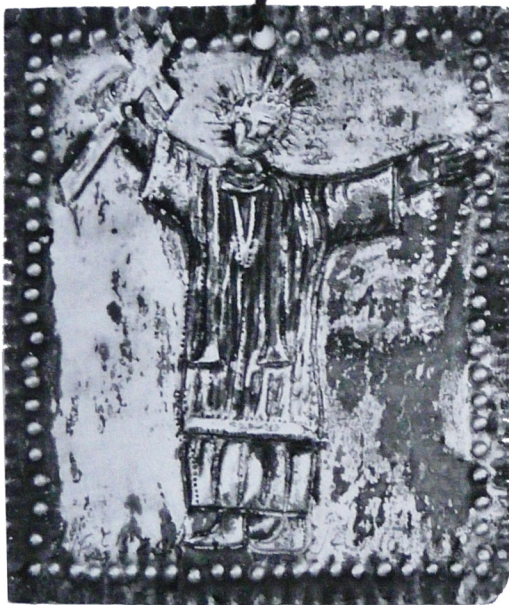
Il. 1 Plakietka wotywna fundowana przez Franciszka Jaśkiewicza, 2 poł. XVIII w., Magazyny Muzeum Diecezjalnego w Toruniu