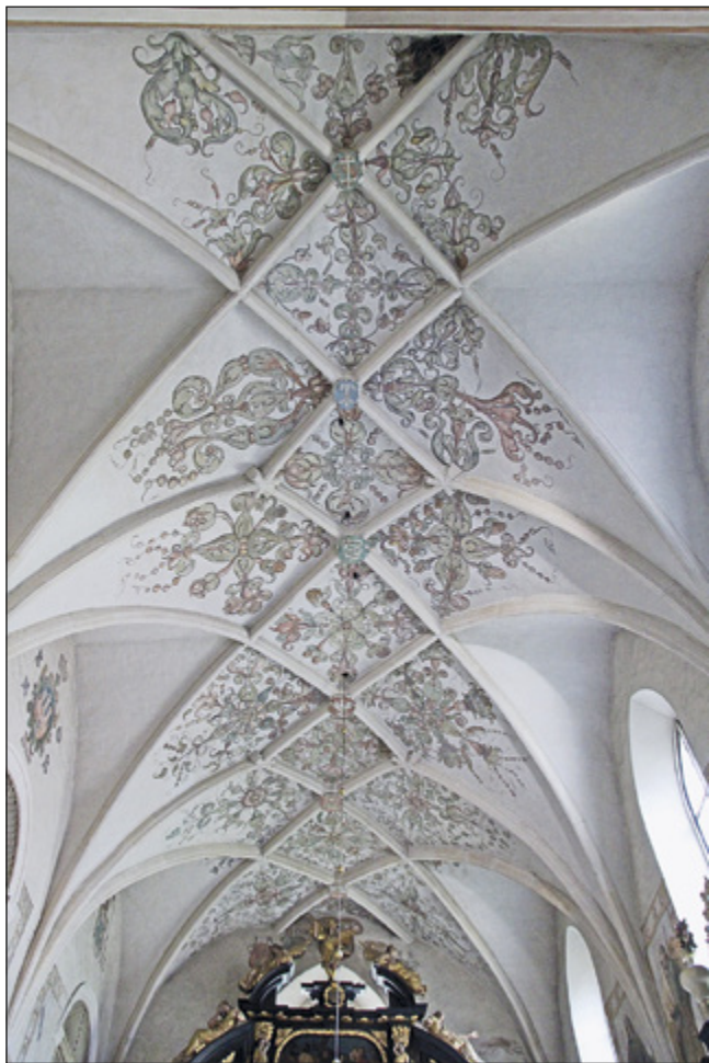
Il. 9. KRAKÓW, kościół św. Krzyża, sklepienie chóru

formami, znajdując bliskie analogie odpowiednio w kościele św. Marcina w Landshucie (po 1407 73 ) i w mortuarium katedry w Eichstätt (1489–1495 74 ).