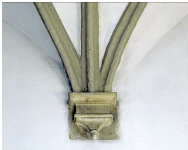
Il. 3. KRAKÓW, Stara Synagoga, jeden ze wsporników sklepienia głównej sali