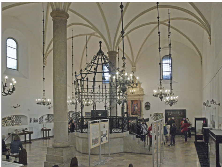
Il. 2. KRAKÓW, Stara Synagoga, wnętrze głównej sali, fot. P. Knapik