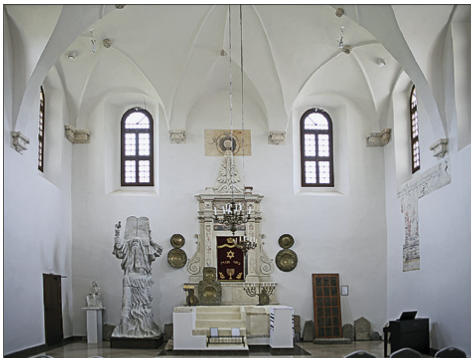
Il. 8. SZYDŁÓW, synagoga, wewnątrz

Blizszą czasowo analogię mogłoby stanowić jedynie sklepienie korpusu fary w Bieczu (il. 12), datowane przez Renatę Frazikową na około 1550 lub drugą połowę XVI wieku 70 . Charakteryzuje się ono dość ciężką formą wsporników żeber, a także baz i kapiteli filarów międzynawowych, dla których ogólne podobieństwa badaczka widziała zarówno w południowoniemieckiej architekturze od XIV do XVI wieku (refektarze w opactwie w Blaubeuren oraz kościoły św. Ducha, św. Jana i katedralny w Pasawie), jak i wśród rozmaitych dorycko-toskańskich form stosowanych w Polsce w trzeciej ćwierci XVI wieku i na początku następnego stulecia 71 . Zaproponowane przez nią analogie wydają się jednak chybione: obecne wsporniki, jak zauważyła sama Frazikowa, mogły zostać tam umieszczone dopiero w XVIII wieku 72 , natomiast w przypadku kapiteli i baz filarów trudno się dopatrzeć jakichkolwiek porządków – charakteryzują się one dosyć nietypowymi, jeszcze gotyckimi