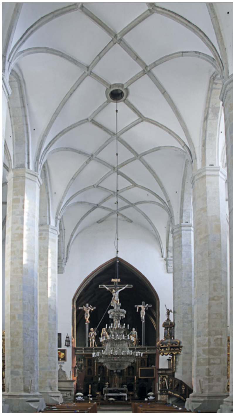
Il. 12. BIECZ, fara, nawa główna