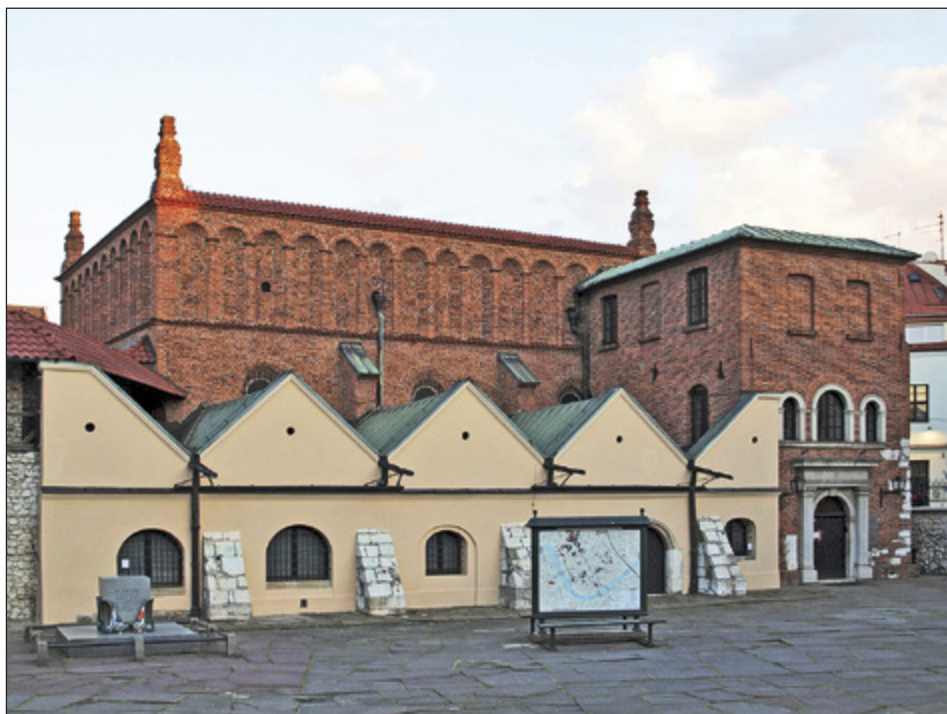
Il. 4. KRAKÓW, Stara Synagoga, fasada od strony północnej, fot. P. Knapik

na odtworzenie starego, ponieważ było to prostsze rozwiązanie. Niezależnie od tego w trzeciej ćwierci XVI wieku taka dyspozycja przestrzenna była już archaiczna, bowiem najprawdopodobniej w tym samym czasie w bożnicach Maharszalszul w Lublinie (1567, niezachowana) i w Brześciu Litewskim (1568, niezachowana) wykształcił się nowy typ, w którym sklepienie podparto czterema centralnie ulokowanymi kolumnami wydzielającymi jednocześnie bime; rozwiązanie to od końca XVI wieku stało się niezwykle popularne w całej Rzeczypospolitej 59 . Co więcej, podczas odbudowy Starej Synagogi nie tylko odtworzono stary układ przestrzennej sali głównej, ale też zdecydowano się nakryć ją gotyckim sklepieniem. Trudno się zgodzić z Rodovem, że nie było to niczym niezwykłym 60 , tym bardziej, że przytoczona przez niego analogia w kościele św. Katarzyny w Augsburgu, wcześniejszym o pół wieku, nie jest trafna. Renesansowe sklepienia były już od drugiej ćwierci XVI wieku z powodzeniem stosowane w Polsce we wznoszonych wtedy wielkich kościołach Mazowsza, takich jak np. katedra w Płocku