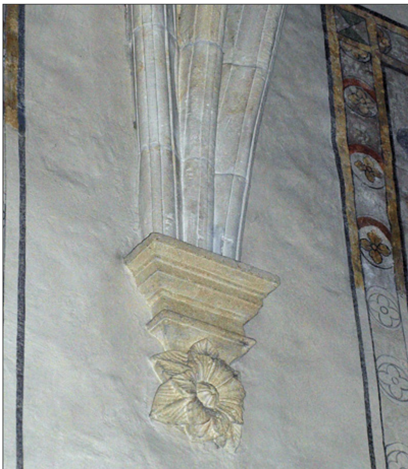
Il. 10. KRAKÓW, kościół św. Krzyża, wspornik sklepienia chóru

Nie zachowało się ono do dzisiaj, co znacznie utrudnia analizę, ale na szczęście przed zburzeniem gmachu w 1892 roku wykonano jego dokumentację 76 . Także i ta konstrukcja powstała w ramach odbudowy po pożarze 77 . Co istotne, jego żebra mają skomplikowaną figurację sieciową. Układy takie stosowano powszechnie w szesnastowiecznych sklepieniach małopolskich (także w tych wcześniej wymienionych), co nie przypomina prostego, krzyżowo-żebrowego rozwiązania