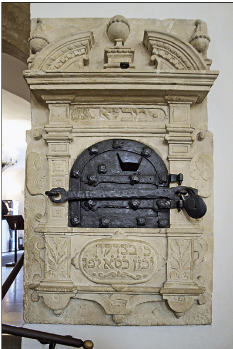
Il. 1. KRAKÓW, Stara Synagoga, skarbonka z datą „1407”, fot. P. Knapik

że w ogóle nie ma w niej jakichkolwiek elementów starszych niż szesnastowieczne 4 . Późniejsi badacze bez wyjątku przyjmowali jej powstanie na XV wiek, przy