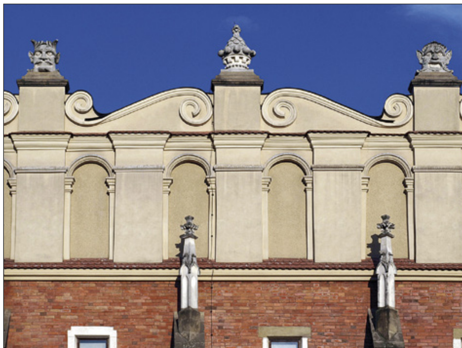
Il. 6. KRAKÓW, Sukiennice, attyka, fot. P. Knapik

stiukowymi listwami 66 ), jednak w krakowskiej architekturze drugiej połowy XVI stulecia trudno wskazać jakiegokolwiek analogie dla Starej Synagogi. Znane dziś gotycko-renesansowe sklepienia w tym mieście pochodzą jeszcze z drugiej ćwierci XVI wieku i znajdują się w bibliotece klasztoru Cystersów w Mogile (między 2. dekadą XVI w. a 1538 r. 67 ) oraz w prezbiterium kościoła Świętego Krzyża (1533 68 ; il. 9). W obu przypadkach zastosowano sklepienia sieciowe