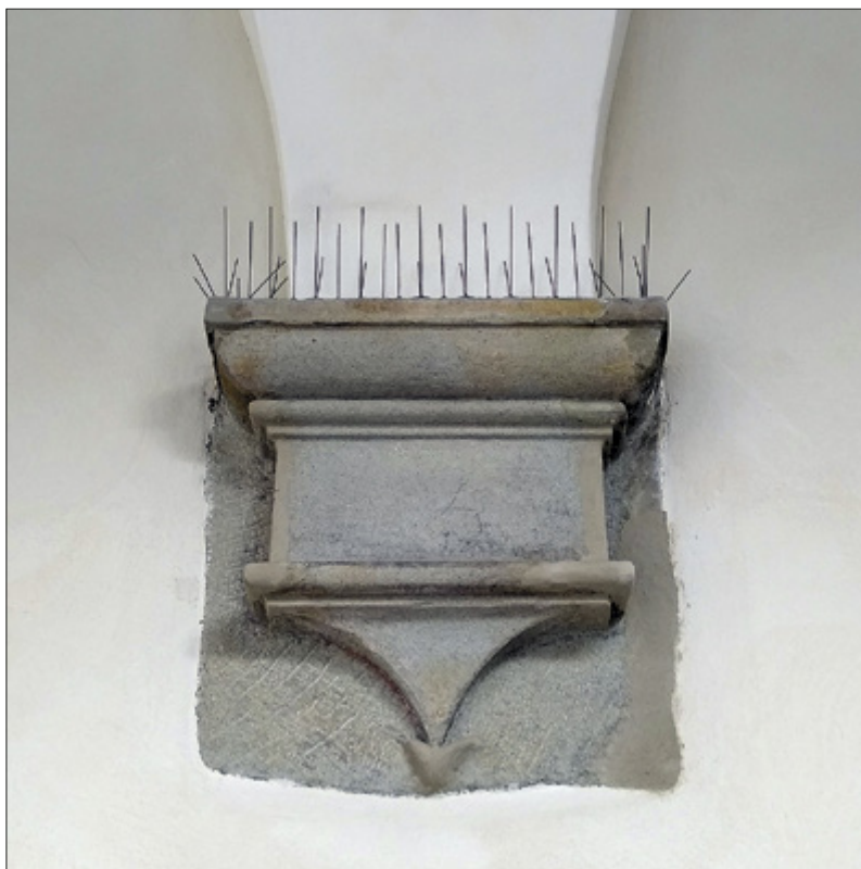
Il. 11. KRAKÓW, Zamek Królewski na Wawelu, wspornik sklepienia w pierwszej kondygnacji wschodniego ramienia krużganków