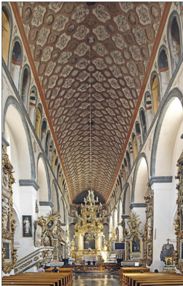
Il. 7. PUŁTUSK, kolegiata, wnętrze

w tzw. typie katedralnym (wywodzącym się z prezbiterium katedry św. Wita, Waclawa i Wojciecha w Pradze) z renesansowymi wspornikami (il. 10), bardzo bliskimi do ich odpowiedników w Starej Synagodze, których forma wywodzi się z krużganków zamku na Wawelu 69 (il. 11).