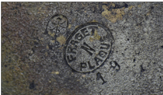
Il. 11. TORUŃ, kościół oo. Jezuitów pw. Ducha św. i św. Stanisława Kostki, puszka, Warszawa – firma Józefa Frageta, l. 1915–1939 – znaki.