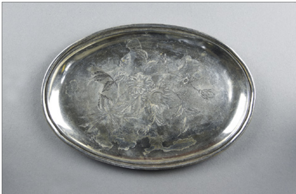
II. 12. TORUŃ, kościół oo. Jezuitów pw. Ducha św. i św. Stanisława Kostki, taca, Warszawa (?) / Moskwa (?) – monogramista BTC (WTS?), l. 1898–1908.