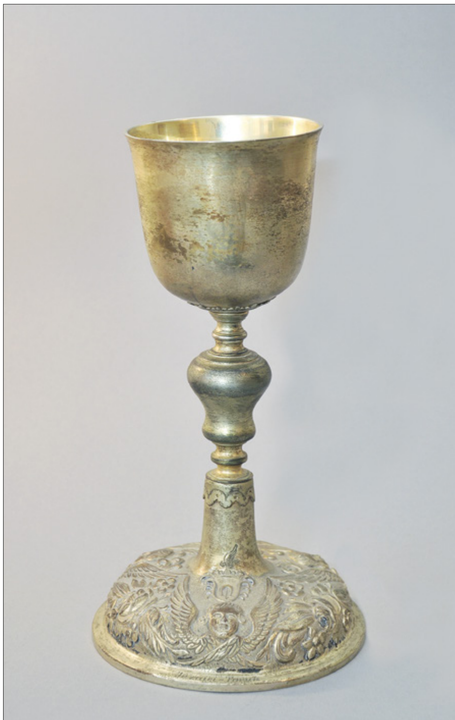
Il. 15. TORUŃ, kościół oo. Jezuitów pw. Ducha św. i św. Stanisława Kostki, kielich z herbem Dołęga (?), ziemie polskie, k. XIX w.