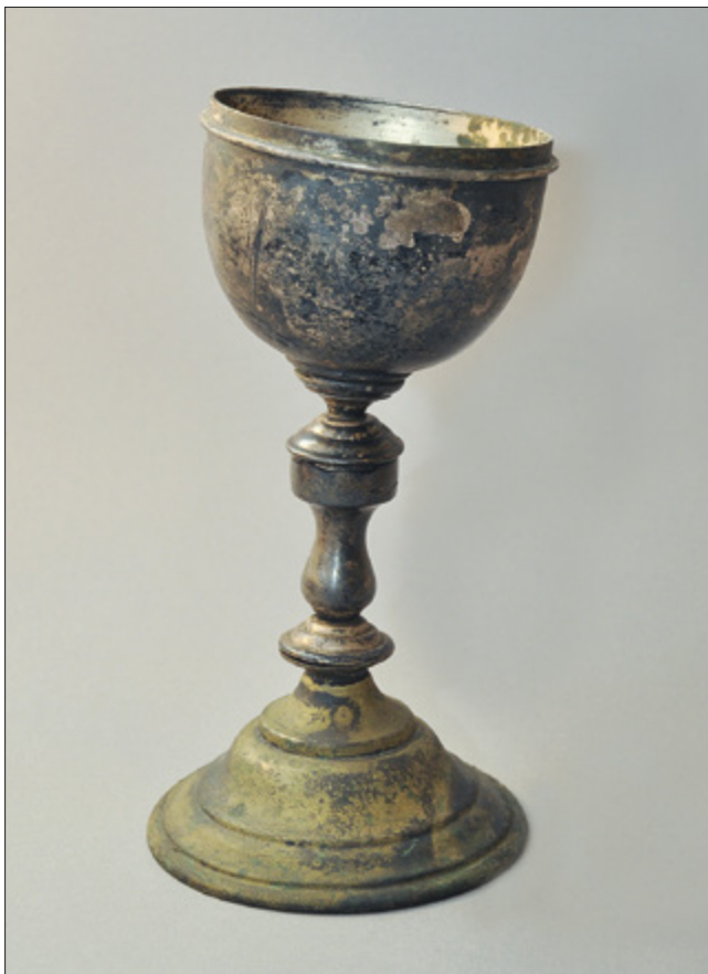
Il. 10. TORUŃ, kościół oo. Jezuitów pw. Ducha św. i św. Stanisława Kostki, puszka, Warszawa – firma Józefa Frageta, l. 1915–1939.