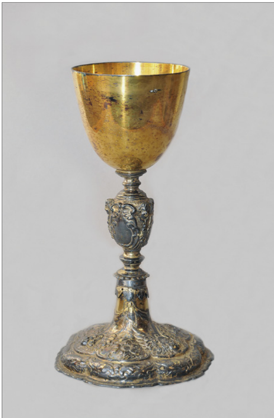
Il. 4. TORUŃ, kościół oo. Jezuitów pw. Ducha św. i św. Stanisława Kostki, kielich, Wiedeń, l. 1872–1922 – trzon i czasza, Polska, poł. lub 3. ćw. XVII w. – stopa.