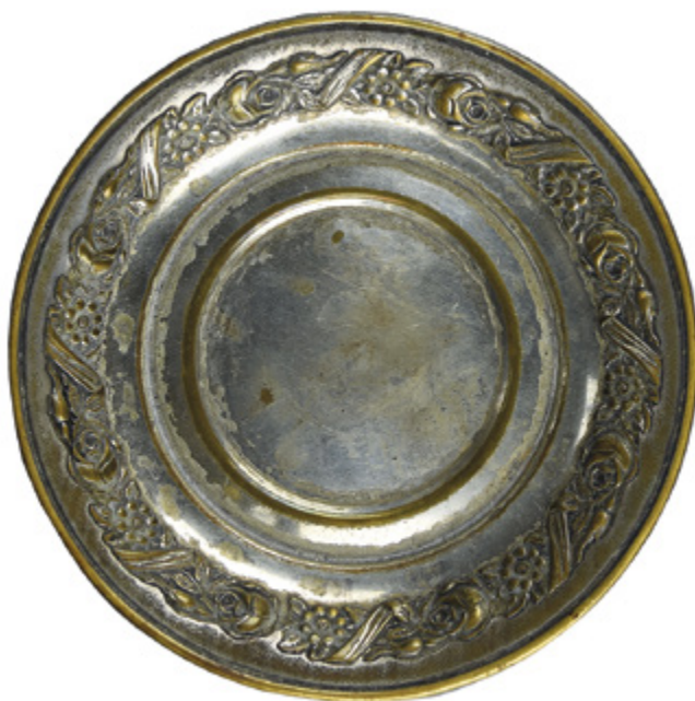
Il. 6. TORUŃ, kościół oo. Jezuitów pw. Ducha św. i św. Stanisława Kostki, talerzyk secesyjny, Wiedeń, fabryka Lenk, pocz. XX w.