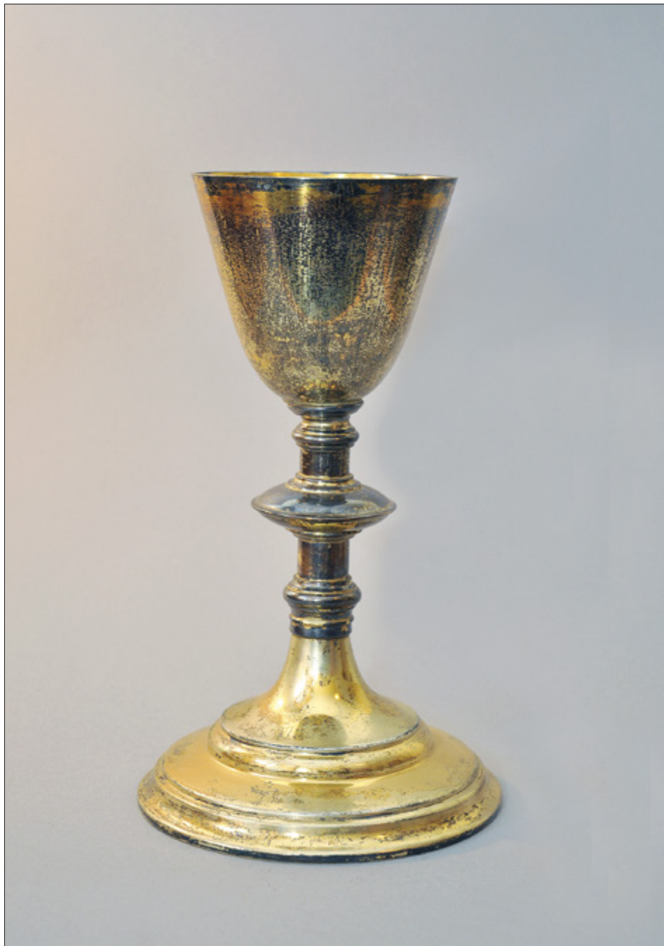
II. 14. TORUŃ, kościół oo. Jezuitów pw. Ducha św. i św. Stanisława Kostki, kielich, Wilno – firma Michała Niewiadomskiego, I. 20. XX w. (?).