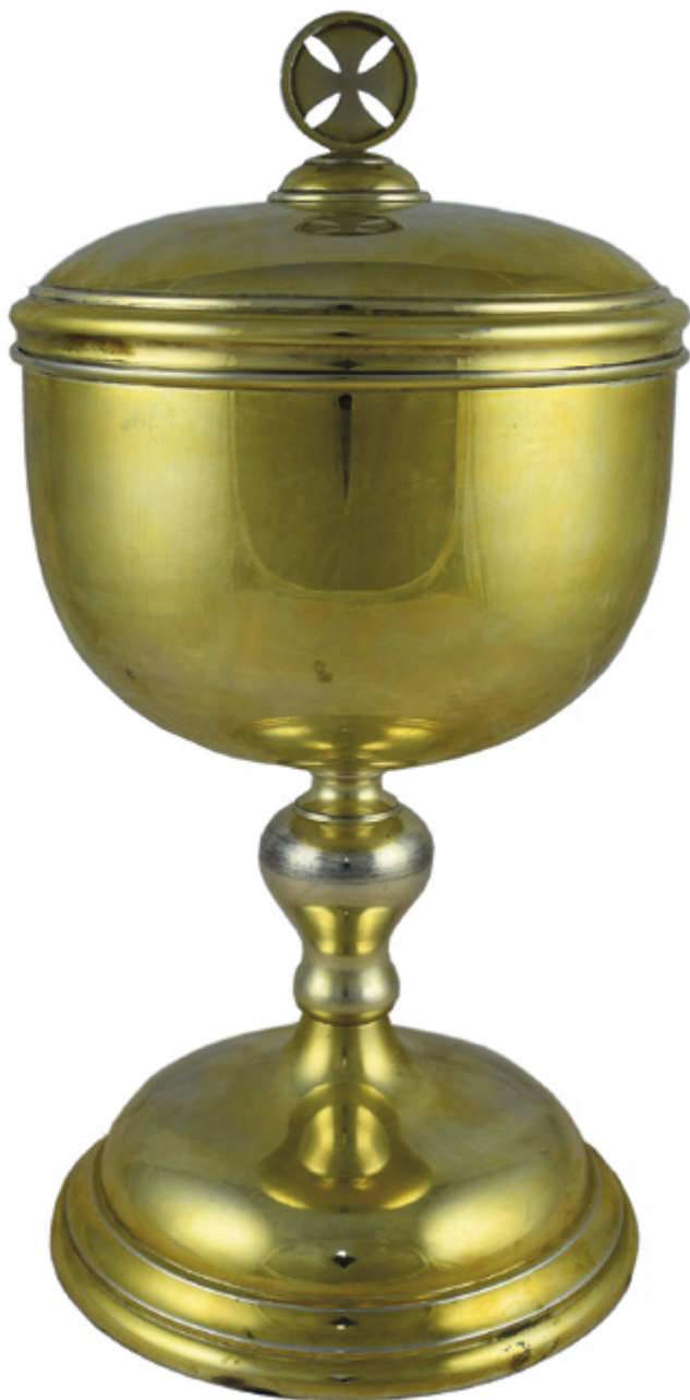
Il. 3. TORUŃ, kościół oo. Jezuitów pw. Ducha św. i św. Stanisława Kostki, puszka, Niemcy (?), 2. ćw. lub poł. XX w.