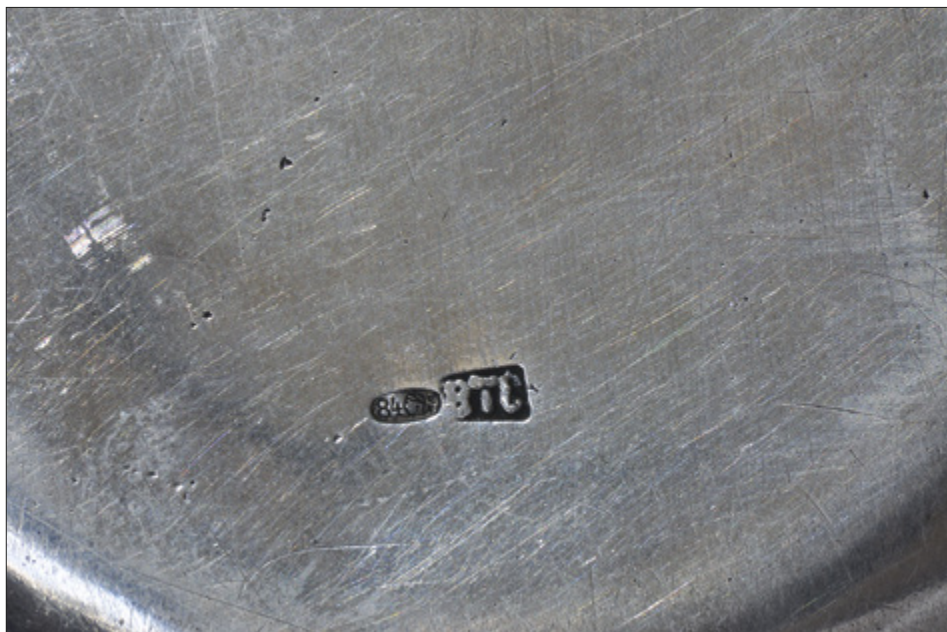
II. 13. TORUŃ, kościół oo. Jezuitów pw. Ducha św. i św. Stanisława Kostki, taca, Warszawa (?) / Moskwa (?) – monogramista BTC (WTS?), l. 1898–1908 – znaki.