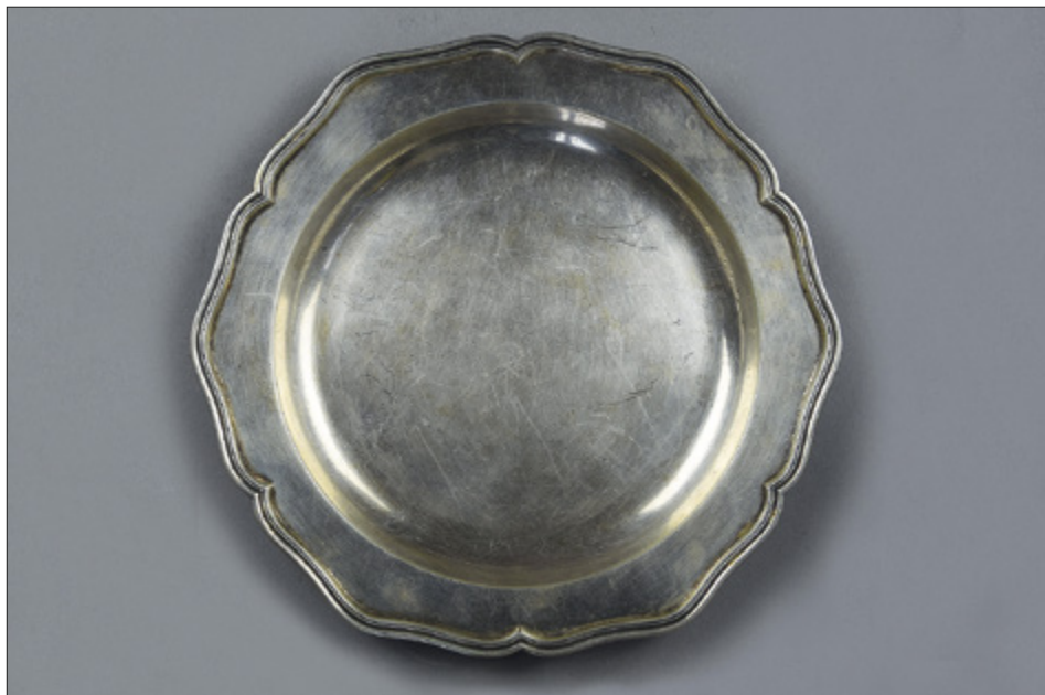
Il. 1. TORUŃ, kościół oo. Jezuitów pw. Ducha św. i św. Stanisława Kostki, misa neorokokowa, Prusy, po 1888 r.