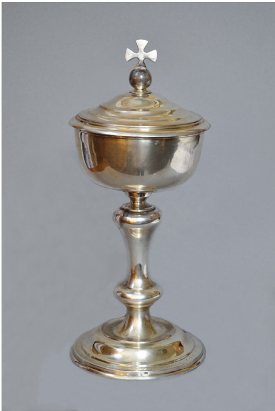
Il. 7. TORUŃ, kościół oo. Jezuitów pw. Ducha św. i św. Stanisława Kostki, puszka, Warszawa – firma Karola Malcza, 1852 r.