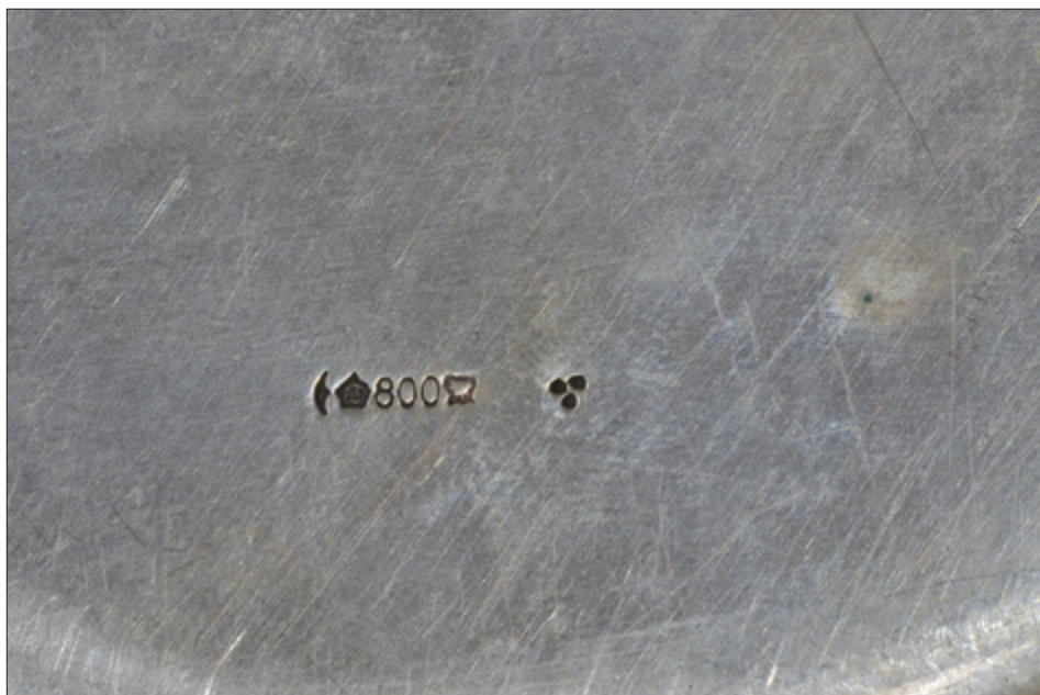
Il. 2. TORUŃ, kościół oo. Jezuitów pw. Ducha św. i św. Stanisława Kostki, misa neorokokowa, Prusy, po 1888 r. – znaki.