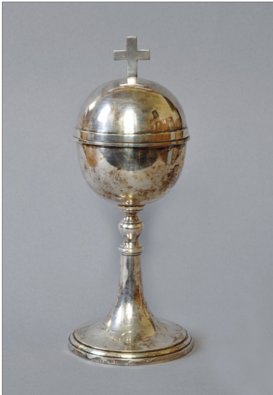
Il. 9. TORUŃ, kościół oo. Jezuitów pw. Ducha św. i św. Stanisława Kostki, puszka, Warszawa – firma Norblin i Spółka, przed 1872 r.