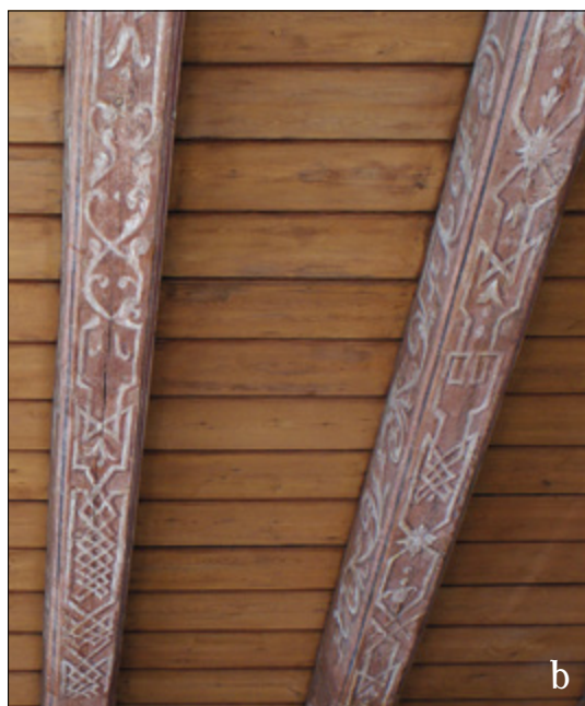
II. 8. TYPOLOGIA DEKORACJI TORUŃSKICH STROPÓW, typ IV: ornament wstęgowo-cęgowy z elementami roślinnymi naśladującymi wić akantu, podtyp IV.1, a) Ratusz Staromiejski, Sala Mieszczarska . Fot. K. Rajmann, b) Ratusz Staromiejski, przedsionek do Sali Rady . Fot. K. Rajmann, c) fragment grafiki Paula Deckera i Johanna Conrada Reiffa (ok. 1710). Źródło: https://media.vam.ac.uk/media/thira/collection_images/2012FG/2012FG6438_jpg_1.jpg (dostęp: 26 VIII 2018), d) rys. Jerzego Fryderyka Steinera. Ryc. wg ALBUM STEINERA 1998, s. 95