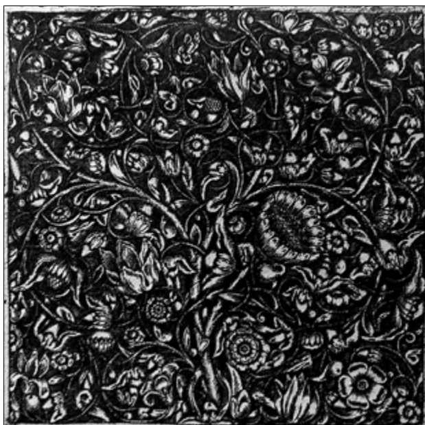
II. 3. TYPOLOGIA DEKORACJI TORUŃSKICH STROPÓW, typ II, „eklektyczny”: swobodnie rozrzucone kwiaty, na przemian z ornamentem akantowym i elementami wstęgowo-cęgowymi, a) kamienica przy ul. Mostowej 40, parter, trakt przedni. Fot. A. Bystron-Kwiatkowska, b) grafika Philippe’a Milota (1650–60). Fot. wg: BERLINER / EGGER 1981, Bd. 2, tabl. 1092