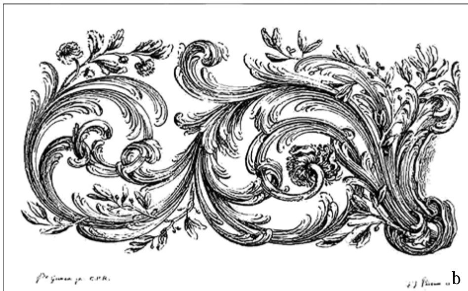
II. 5. TYPOLOGIA DEKORACJI TORUŃSKICH STROPÓW, typ III: barokowy, mięsisty akant, a) kamienica przy ul. Łaziennej 22, parter, korytarz w trakcie tylnym. Fot. K. Rajmann, b) grafika Pierre'a Germaina II (1751). Fot. wg: BERLINER / EGGER 1981, Bd. 2, tabl. nr 1310