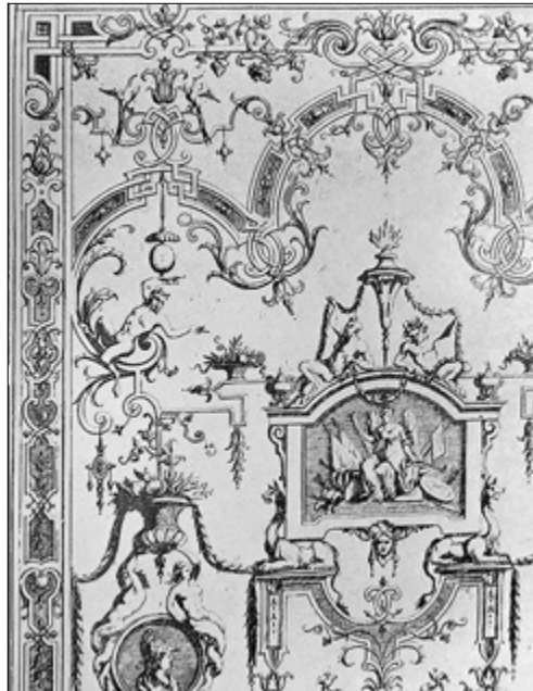
II. 6. TYPOLOGIA DEKORACJI TORUŃSKICH STROPÓW, typ IV: ornament wstęgowo-cęgowy z elementami roślinnymi naśladowującymi wić akantu, podtyp IV.1, z wplecionymi kwiatkami, główkami dziecięcymi, kwiatkami regencyjnymi, a) kamienica przy ul. Chełmińskiej 28, III piętro (poddasze), Fot. wg: www.turystyka.torun.pl (dostęp: 26 VIII 2018), b) grafika Jeana Berraina (ok. 1690). Fot. wg: BERLINER / EGER 1981, Bd. 2, tabl. 1137 (fragment)