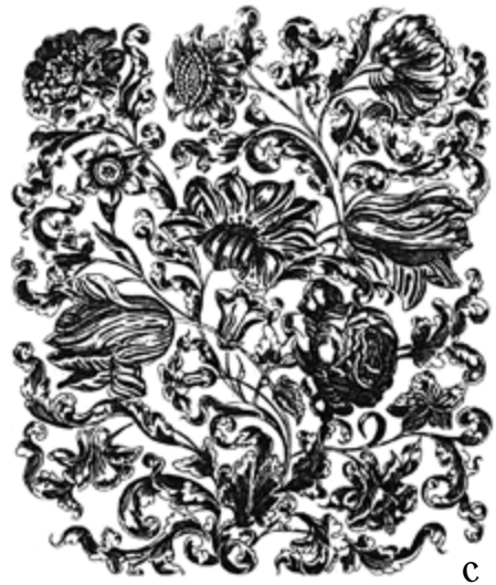
II. 2. TYPOLOGIA DEKORACJI TORUŃSKICH STROPÓW, typ I, a) kamienica przy ul. Łaziennej 24, parter, trakt tylny. Fot. K. Rajmann, b) ten sam strop, detal. Fot. K. Rajmann, c) grafika Johannes Tünkela (1661). Fot. wg: BERLINER / EGGER 1981, Bd. 2, tabl. 1034