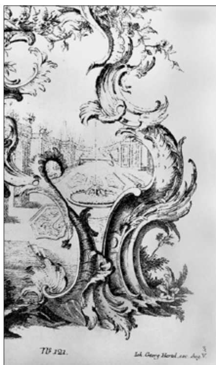
II. 10. TYPOLOGIA DEKORACJI TORUŃSKICH STROPÓW, typ V: ornament rocaille'owy, podtyp V.1, swobodny, rozmalowany i mięsisty, a) kamienica przy Rynku Nowomiejskim 3, parter, trakt tylny. Fot. K. Rajmann, b) grafika Franza Xavera Habermanna (ok. 1755). Fot. wg: BERLINER / EGGER 1981, Bd. 2, tabl. nr 1416