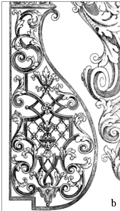
II. 4. TYPOLOGIA DEKORACJI TORUŃSKICH STROPÓW, typ II, a) kamienica przy ul. Królowej Jadwigi 8, parter, trakt przedni. Fot. K. Rajmann, b) grafika Franza Leopolda Schmittnera (ok. 1730). Fot. wg: BERLINER /EGGER 1981, Bd. 2, tabl. 1246 (fragment)