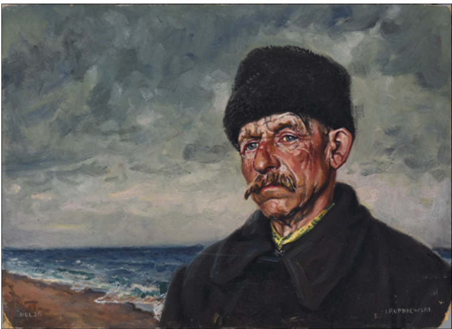
Il. 7. Jerzy Rupniewski, Rybak , 1936, olej na kartonie, wym. 50,5 × 70,5 cm, sygn. p.d.: I. RUPNIEWSKI, l.d.: HEL 36, Muzeum Okręgowe w Bydgoszczy, nr inw. MOB/MW/48.