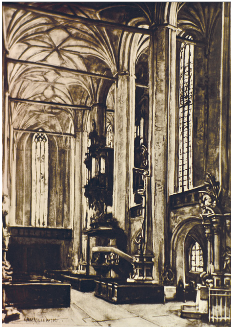
Il. 9. Jerzy Rupniewski, Wnętrze kościoła NMP w Toruniu , sygn. l.d.: I. RUPNIEWSKI. Fot. wg: WYSTAWA JUBILEUSZOWA 1947, brak nr il.