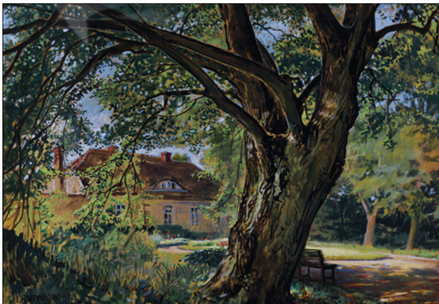
Il. 5. Jerzy Rupniewski, Łabiszyn – Wyspa , przed 1939, akwarela, gwasz na kartonie, wym. 70 × 100 cm, sygn. l.d.: J. RUPNIEWSKI/ŁABISZYN WYSPA, Muzeum Okręgowe w Bydgoszczy, nr inw. MOB/MW/2296.