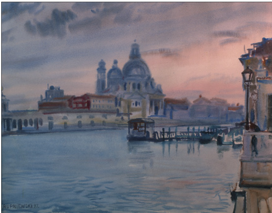
Il. 1. Jerzy Rupniewski, Motyw z Wenecji V , 1927, akwarela, wym. 41 × 51 cm, sygn. l.d.: RUPNIEWSKI.27., Muzeum Okręgowe w Bydgoszczy, nr inw. MOB/MW/2360.