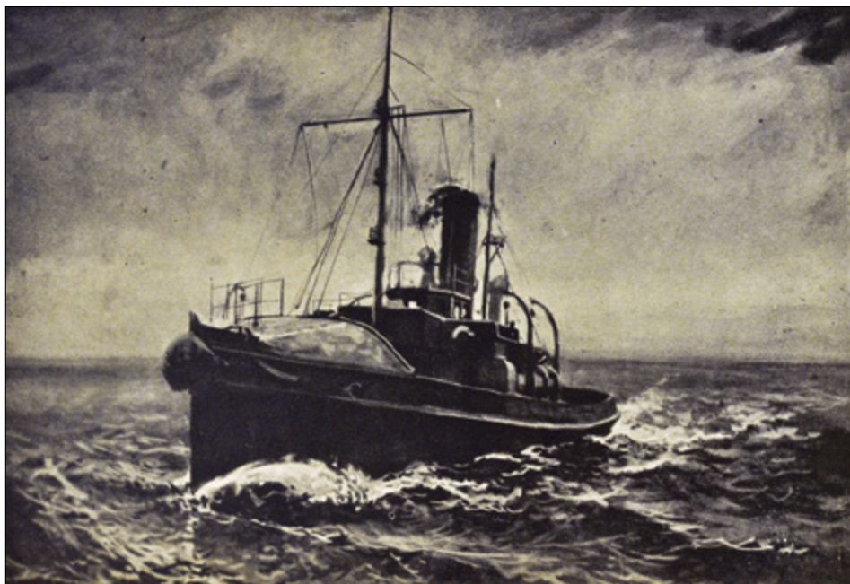
Il. 8. Jerzy Rupniewski, O.R.P. Lech .