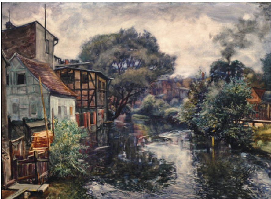
Il. 4. Jerzy Rupniewski, Wenecja Bydgoska , 1936, akwarela, wym. 71,5 × 98,5 cm, sygn. l.d.: J. RUPNIEWSKI, Muzeum Okręgowe w Bydgoszczy, nr inw. MOB/MW/55.