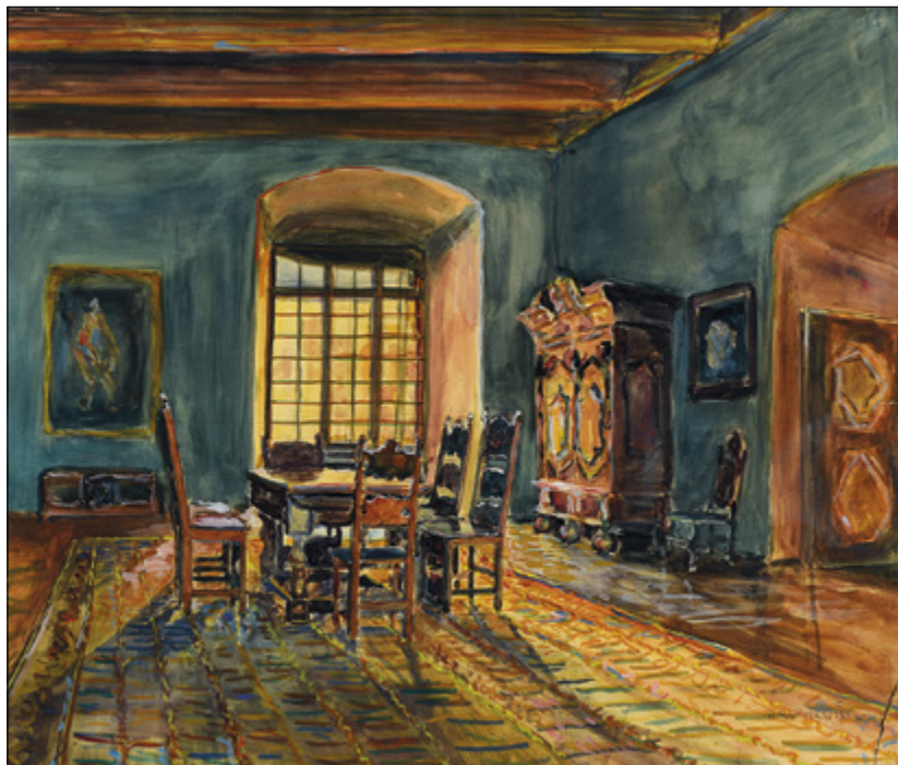
Il. 10. Jerzy Rupniewski, Wawel, przed 1923 r. , akwarela, wym. 72 × 102 cm, sygn. p.d. J. RUPNIEWSKI WAWEL, Muzeum Okręgowe w Bydgoszczy, nr inw. MOB/MW/60.