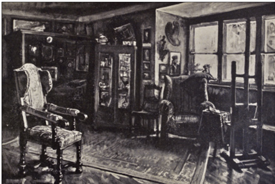
Il. 11. Jerzy Rupniewski, Wnętrze pracowni artysty , 1936, tempera