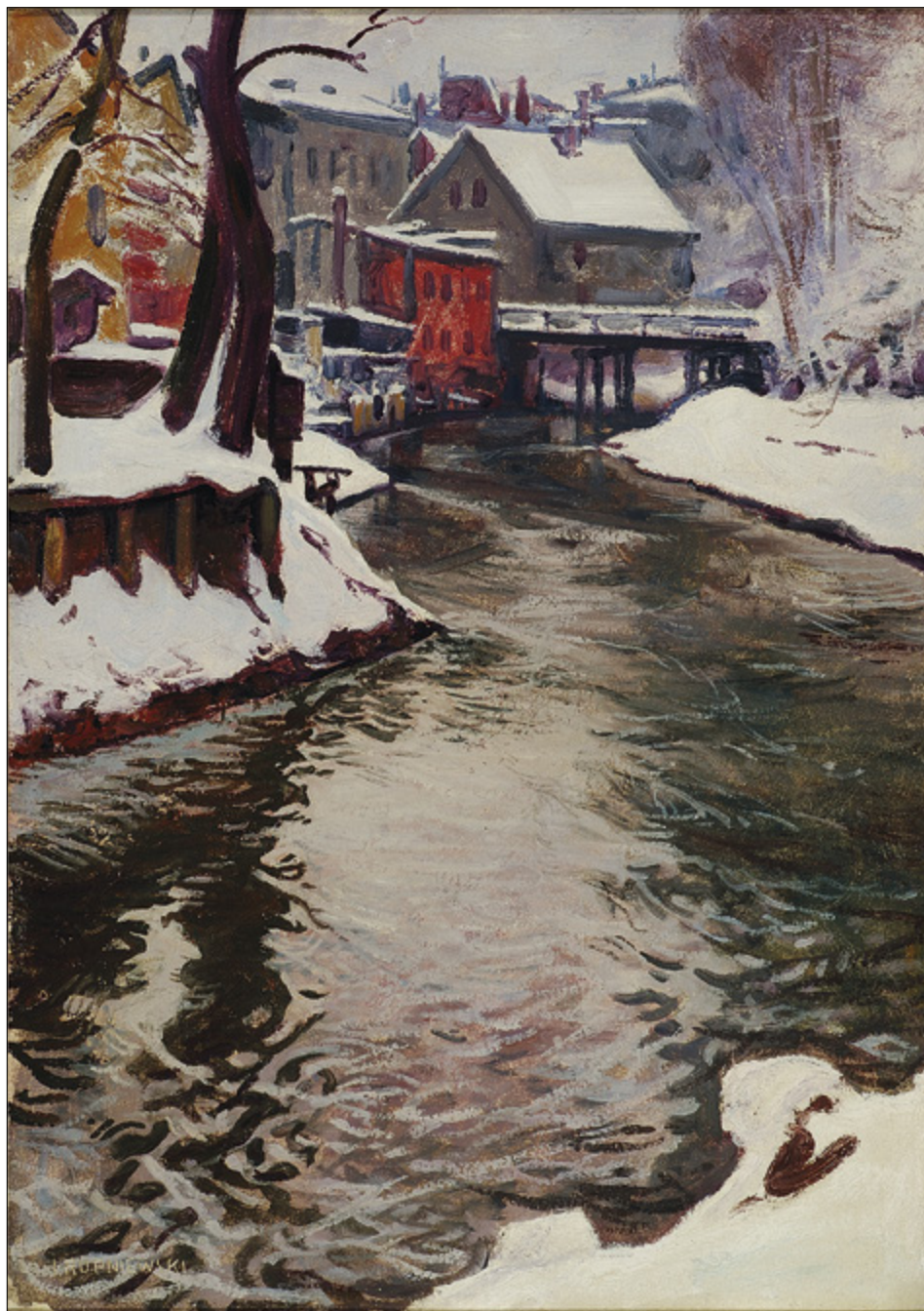
Il. 3. Jerzy Rupniewski, Wenecja Bydgoska zimą , 1928, olej na kartonie, wym. 48 × 34 cm, sygn. p.d.: J. RUPNIEWSKI, Muzeum Okręgowe w Bydgoszczy, nr inw. MOB/MW/34.