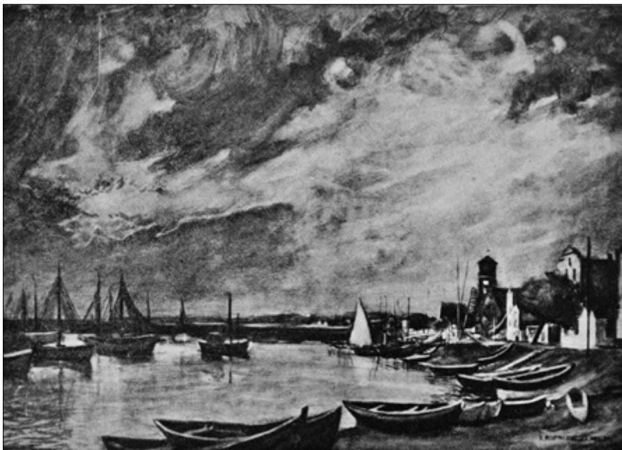
Il. 6. Jerzy Rupniewski, Pejzaż holenderski z Helu , 1934, akwarela.