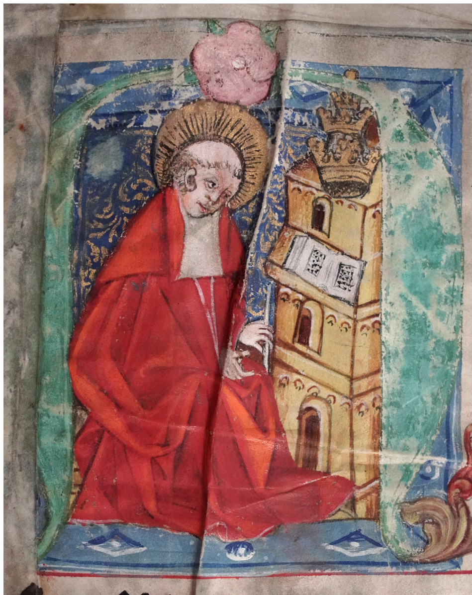
Il. 4. Graduale de tempore , Toruń, Muzeum Diecezjalne, nr inw. MDT-K-003, k. 1r – inicjał A(d) z wizerunkiem św. Grzegorza.