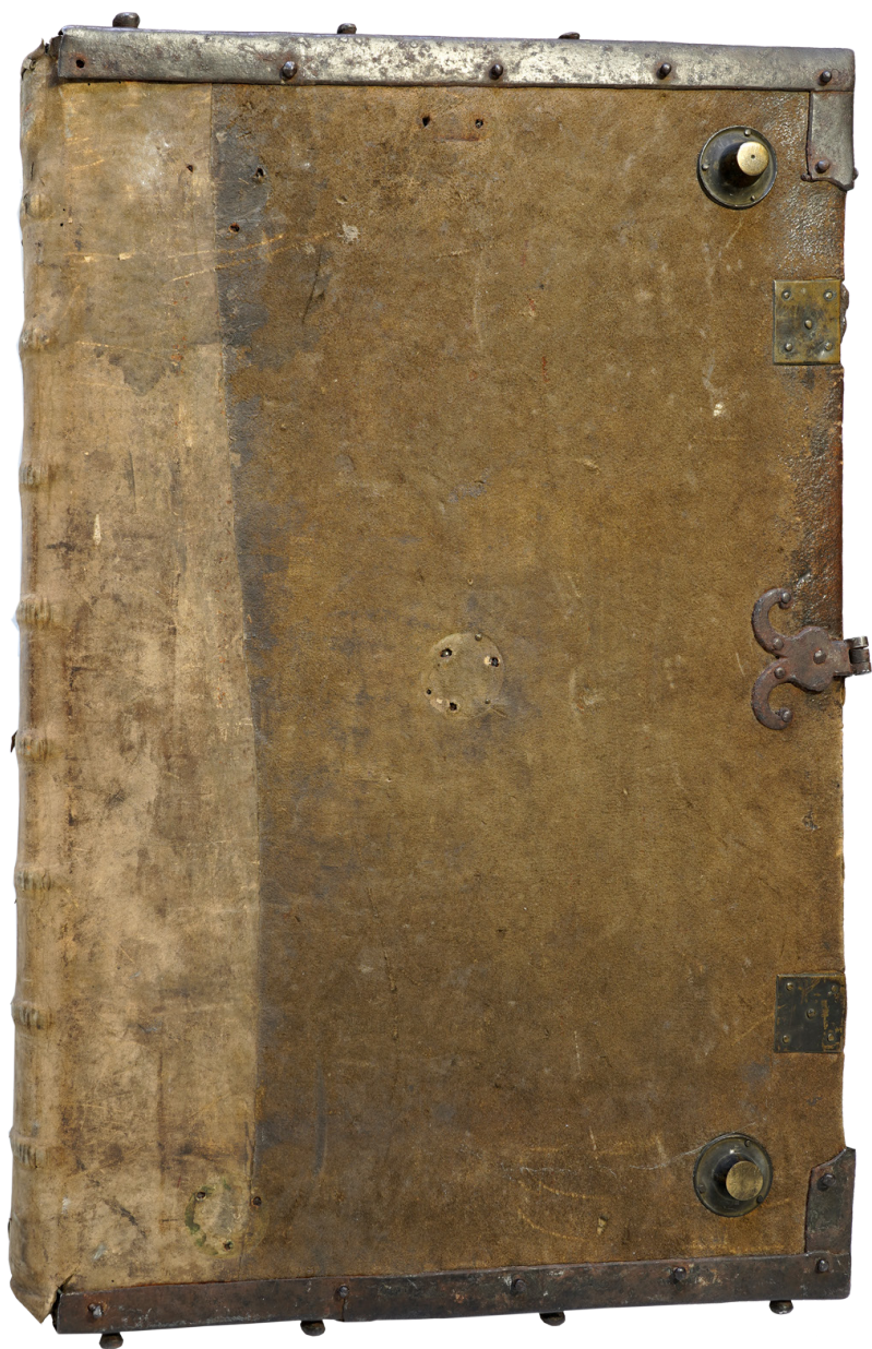
Il. 3. Graduale de tempore , Toruń, Muzeum Diecezjalne, nr inw. MDT-K-003, przednia okładzina oprawy.