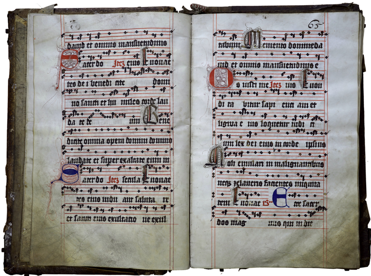
Il. 5. Graduale de sanctis , Pelplin, Biblioteka Diecezjalna, sygn. L2, kodeks otwarty na k. 12v–13r (wg współczesnej foliacji).