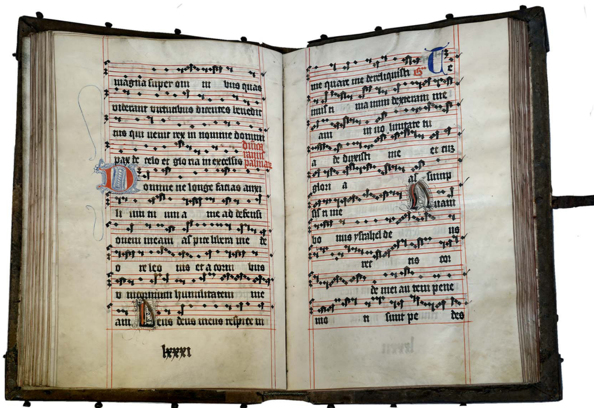
Il. 2. Graduale de tempore , Toruń, Muzeum Diecezjalne, nr inw. MDT-K-003, kodeks otwarty na k. 81v-82r.