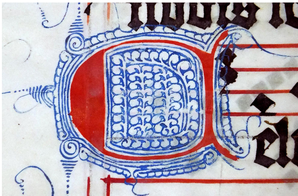
Il. 7. Graduale de tempore , Pelplin, Biblioteka Diecezjalna, sygn. L2, k. 70v (wg współczesnej foliacji) – inicjał C(eli).