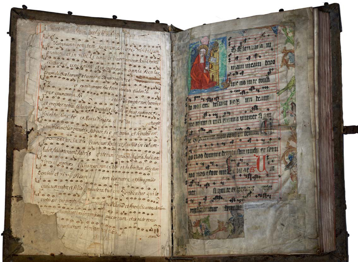
Il. 1. Graduale de tempore , Toruń, Muzeum Diecezjalne, nr inw. MDT-K-003, kodeks otwarty na k. 1r.